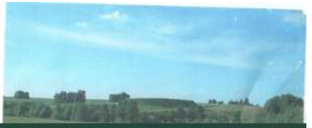
Окраина села. Городище