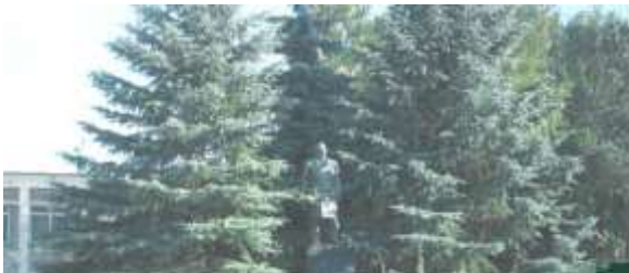
Центральная площадь села