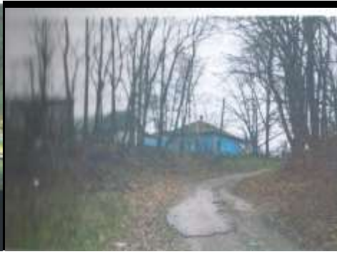
Старая улица Баклани